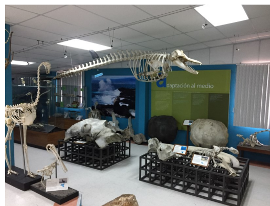
Arriba: Área de colecciones en el INABIO.